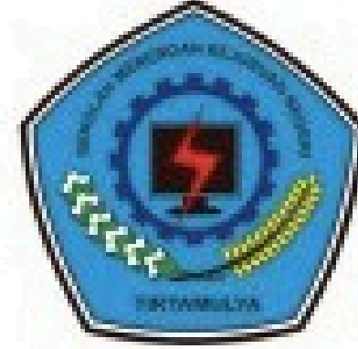
Smk N 1 Tirtamulya Karawang