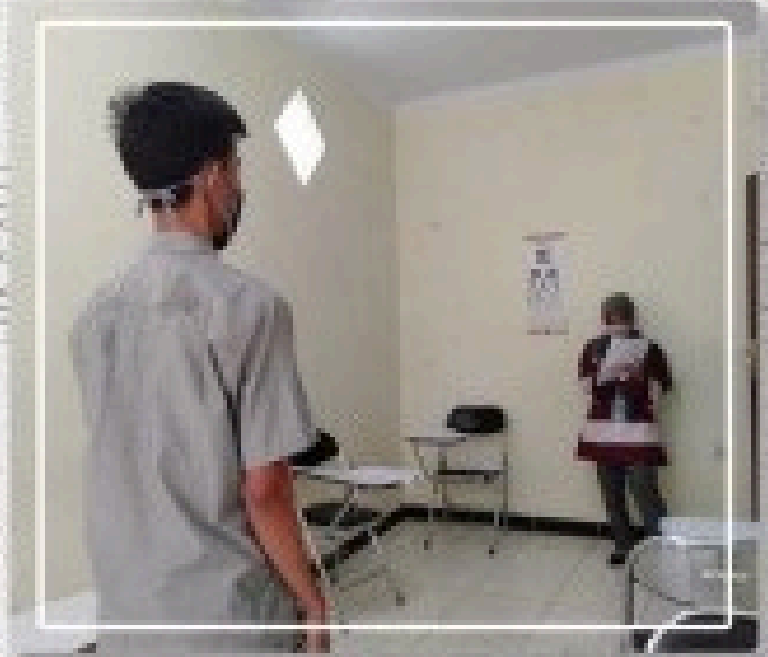
Proses Pengecekan Mata