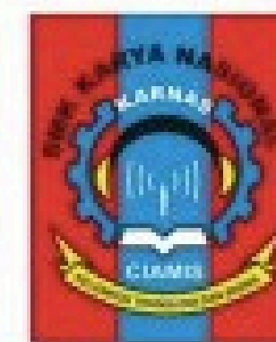
Smk Karnas Ciamis