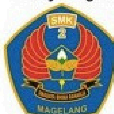
Smk N 2 Magelang