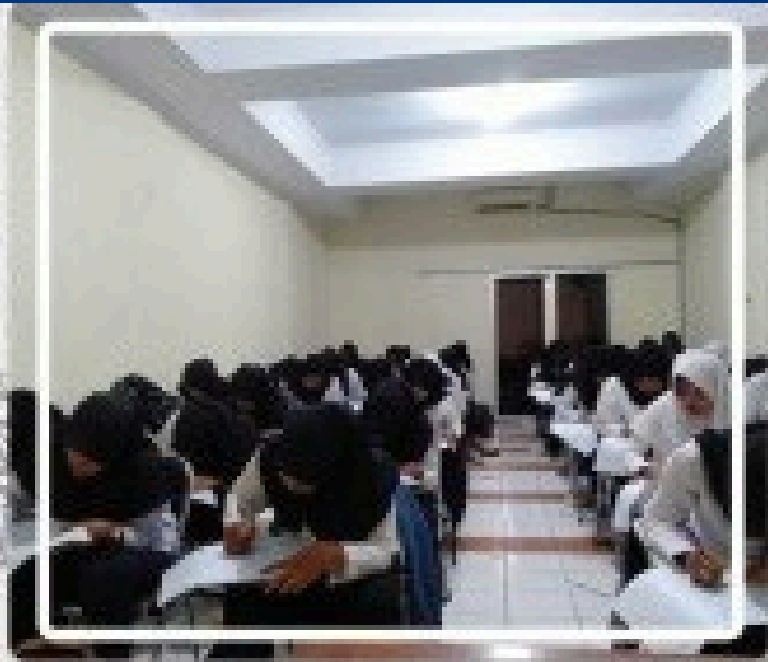
Proses seleksi test perusahaan di Sinergia