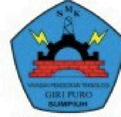
Smk Giri Puro Sumpiuh Banyumas