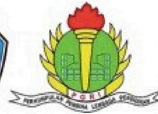
Smk PGRI 1 Palimanan