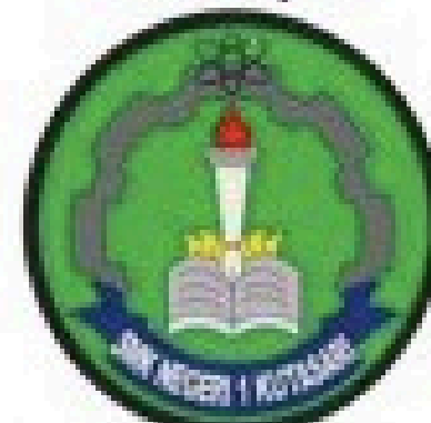
Smk N 1 Kutasari Purbalingga