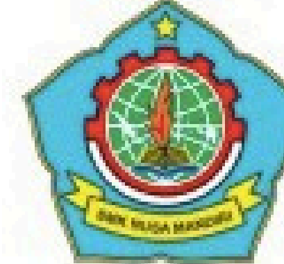
Smk Nusa Mandiri Pemalang