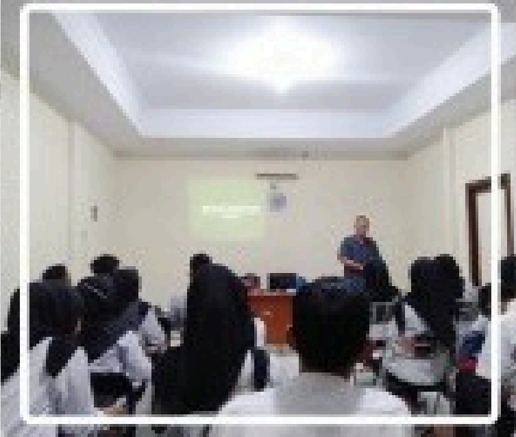
Training Pemagangan untuk Calon karyawan Perusahaan