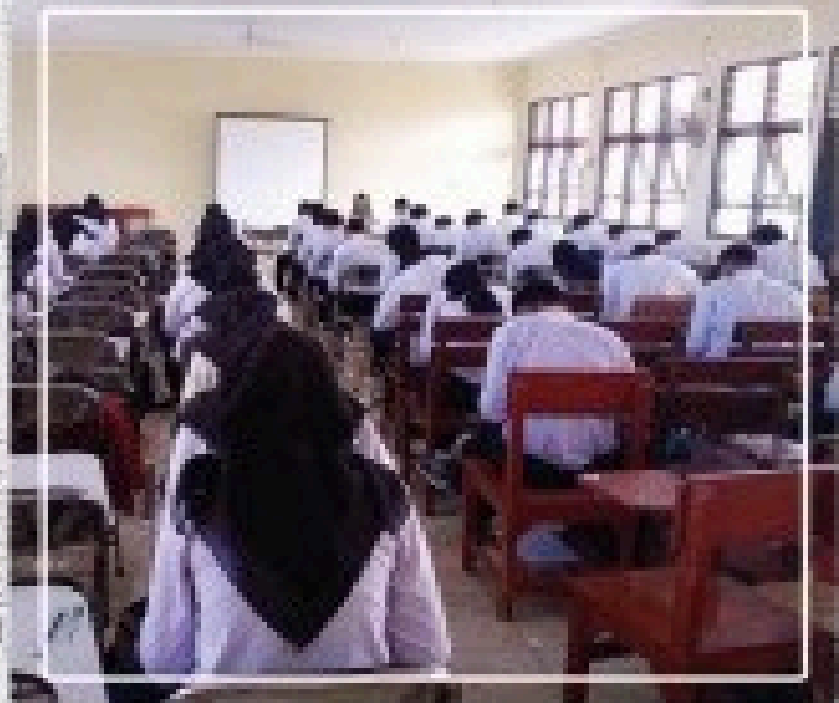
Proses Recruitment di BKK