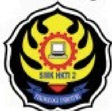
Smk HKTi 2 Klampok Banjarnegara