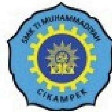
Smk TI Muhammadiyah Cikampek