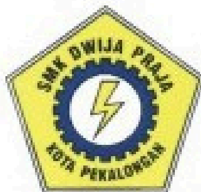
Smk Dwija Praja Pekalongan