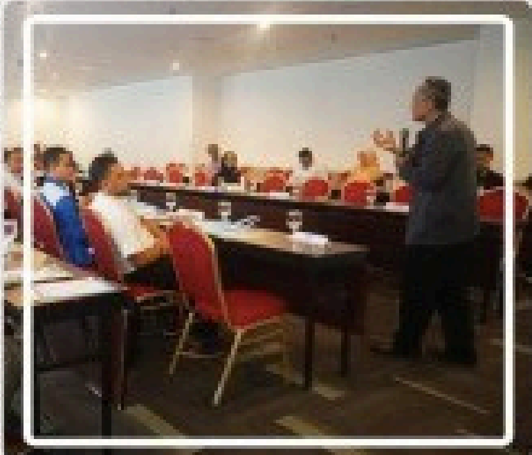
Training disalah satu Client Perusahaan