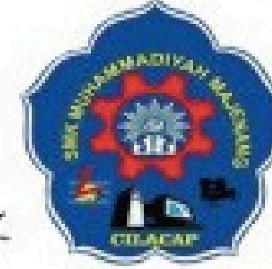
Smk Muhammadiyah Majenang Cilacap