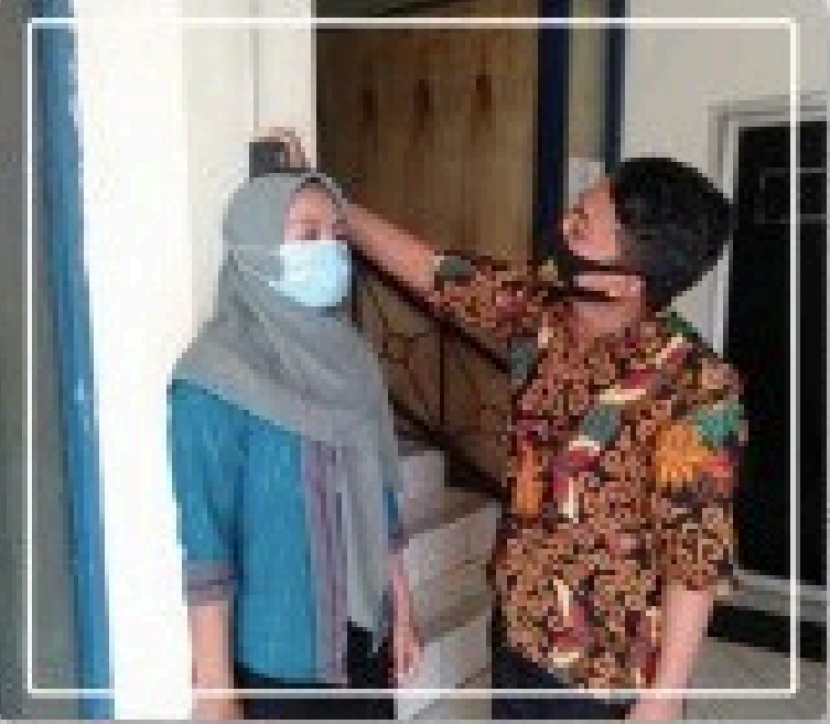
Proses Pengecekan Tinggi badan & Berat badan